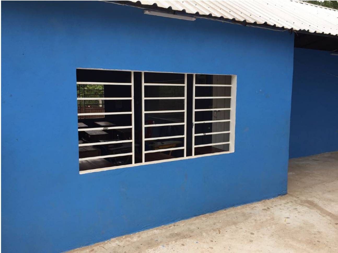
Vue sur une nouvelle classe