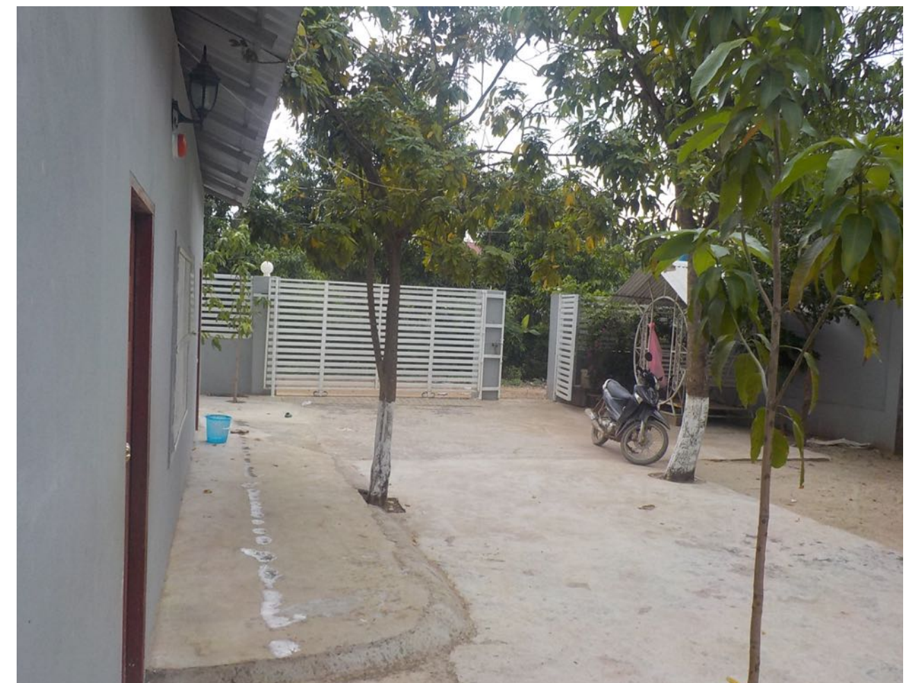
Le nouveau portail