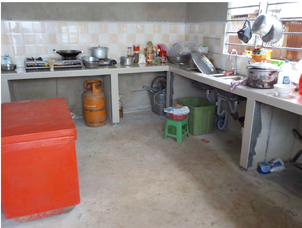
La cuisine en dur