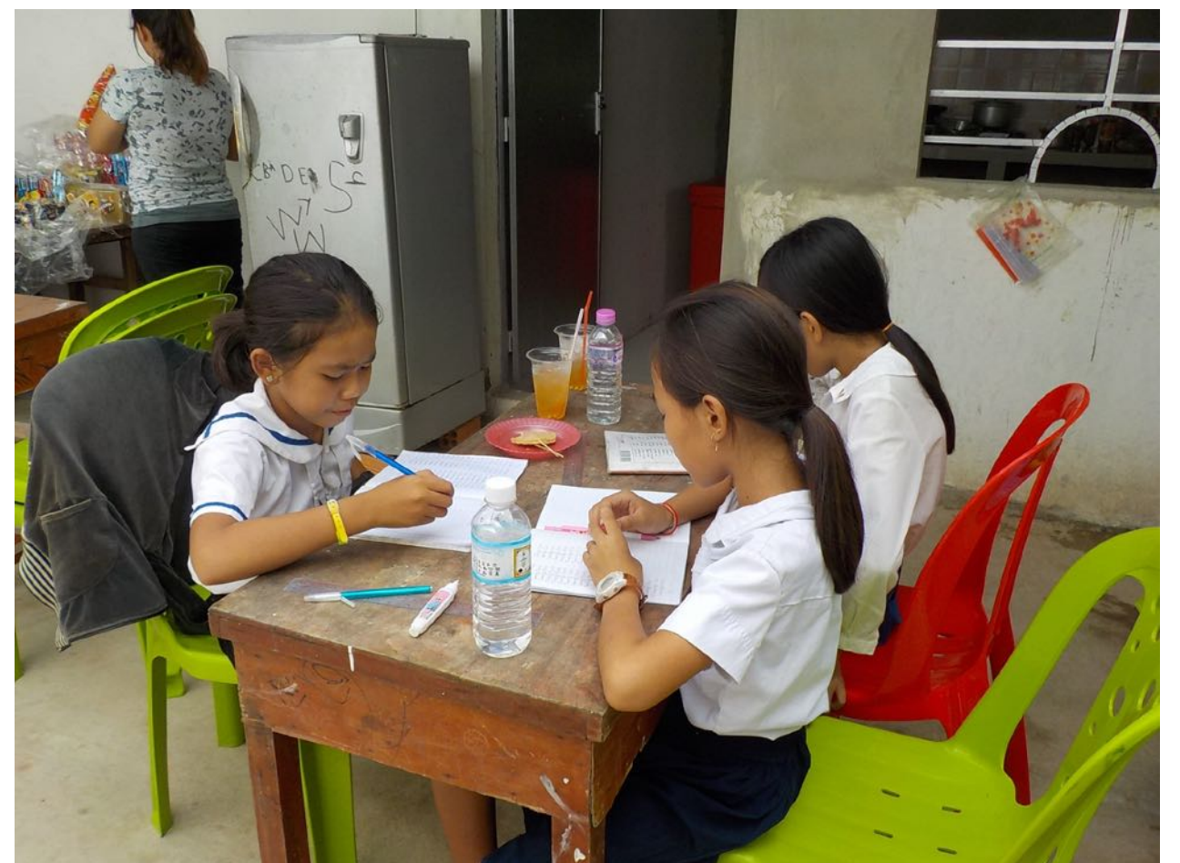
Détente devant la cuisine