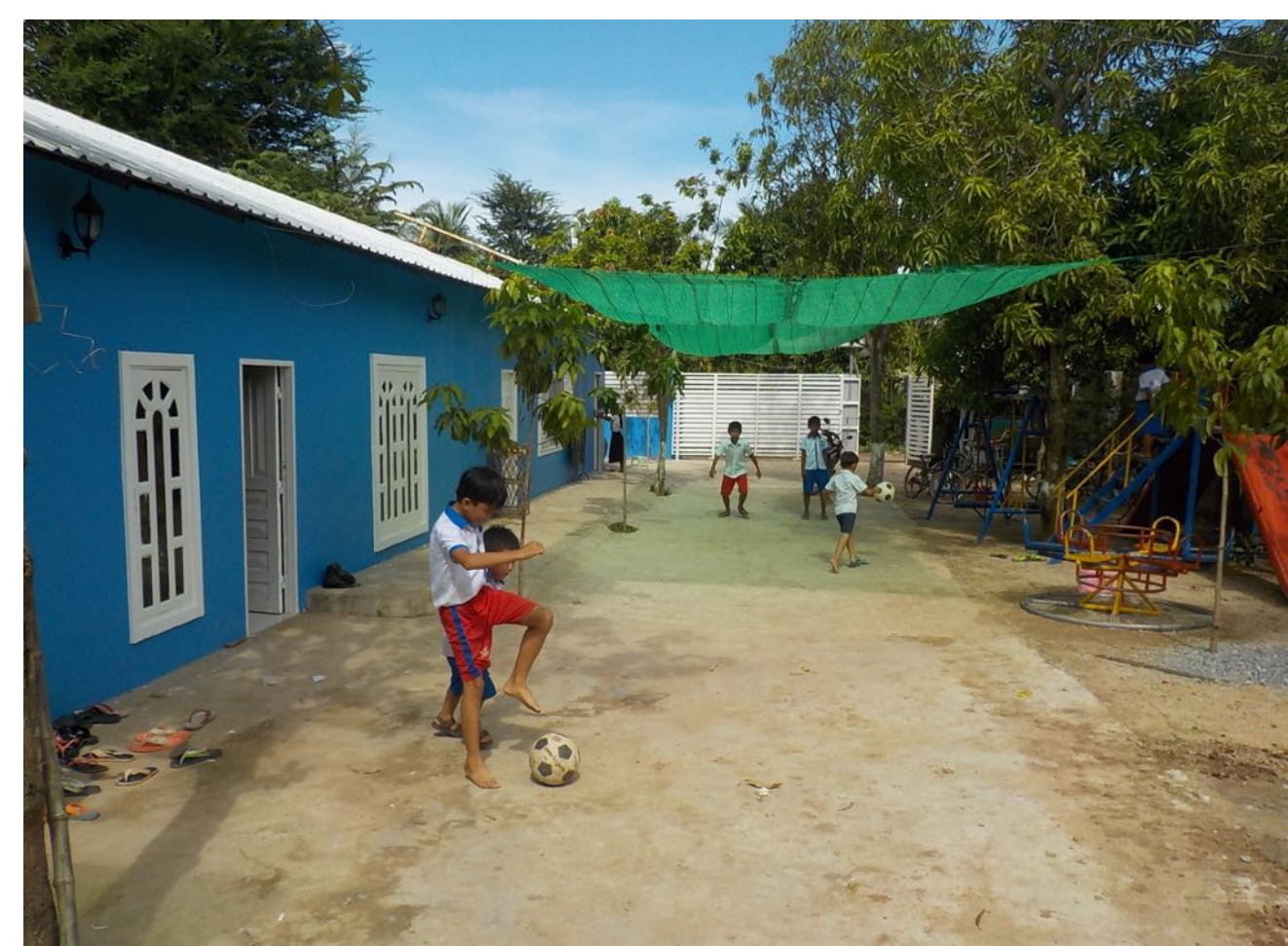
Même s'il reste des travaux d'aménagement extérieur à prévoir, le portail est posé pour la sécurité