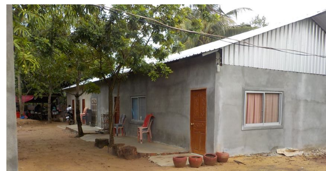
L'unique bâtiment de la nouvelle école avant le projet d'extension