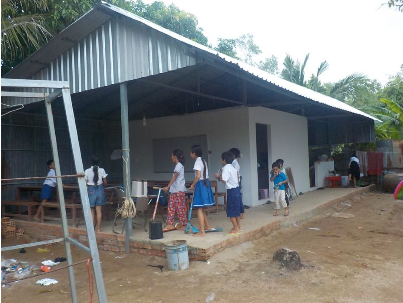
Les 2 salles de classe et le coin cuisine en construction