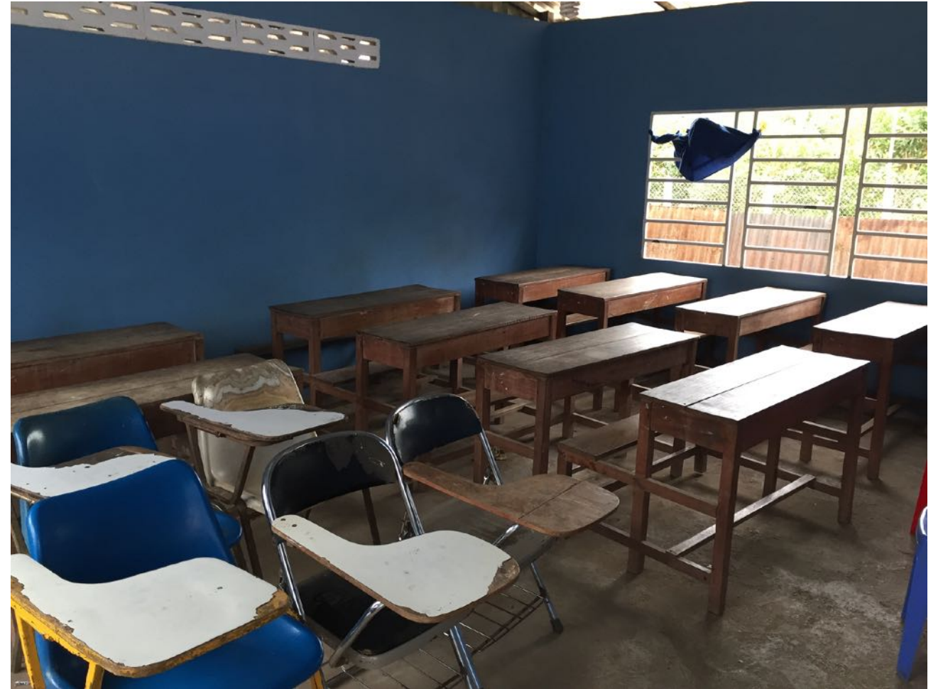
Dans une des nouvelles classes