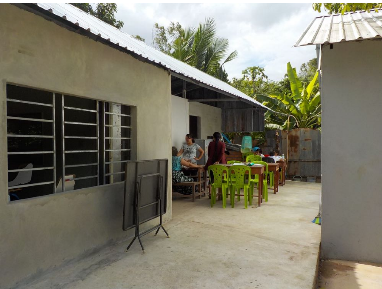
La construction des 2 salles de classe et du coin cuisine achevée