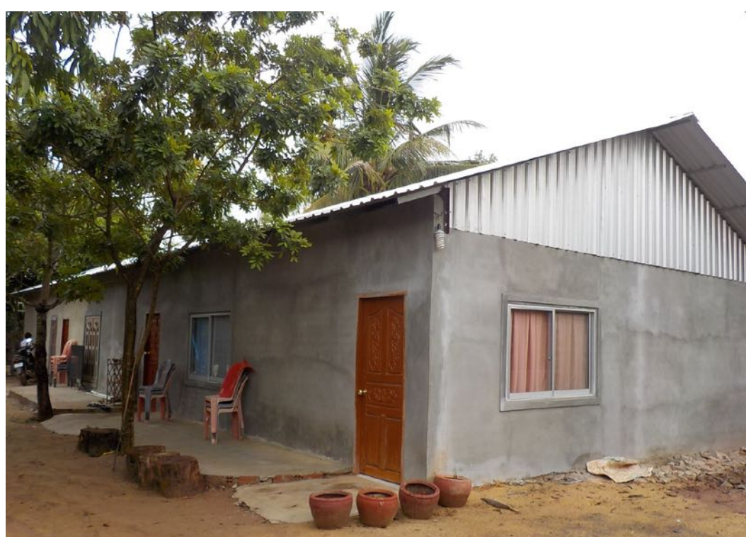
La nouvelle école en devenir

Ce projet s'inscrit dans un objectif plus général de scolarisation d'un plus grand nombre d'enfants très défavorisés.