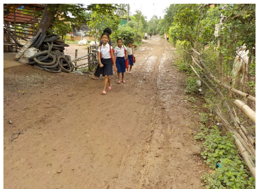
Les élèves les plus proches de l'école viennent à pied