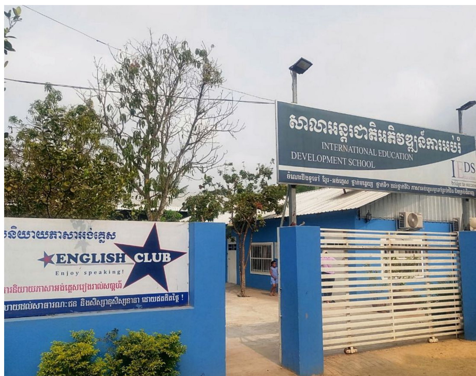
Le portail et la nouvelle signalétique IEDS à Prek Thmey