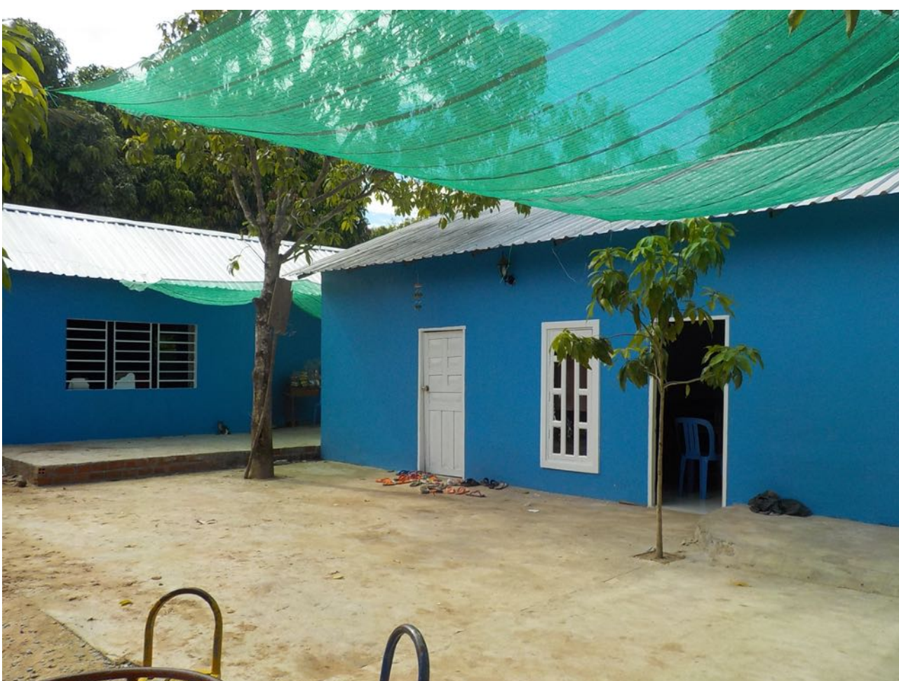
Finition des travaux avec la peinture; le bâtiment financé est au fond