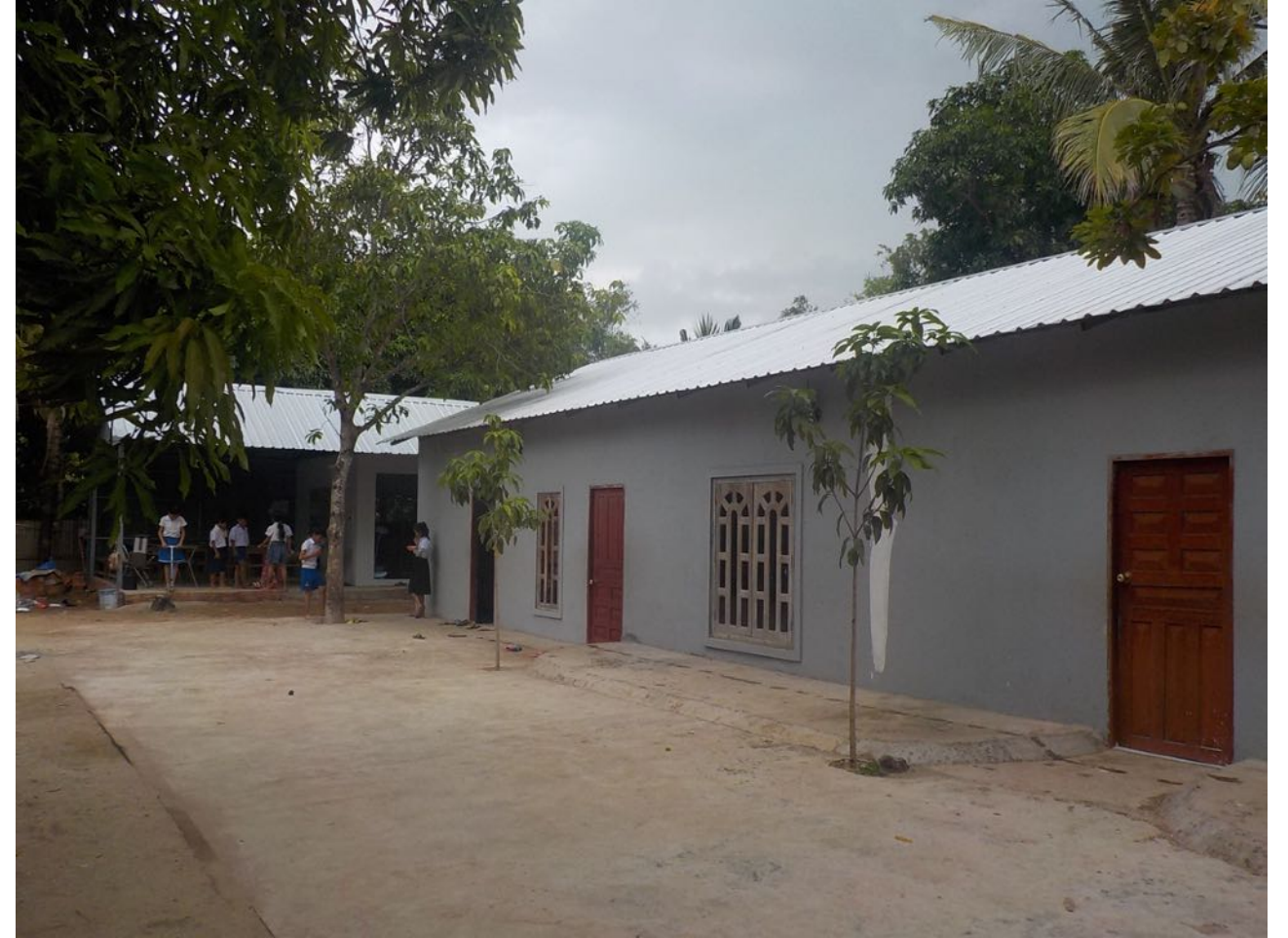
Le nouveau bâtiment des classes se trouve au fond du terrain derrière le bâtiment initial