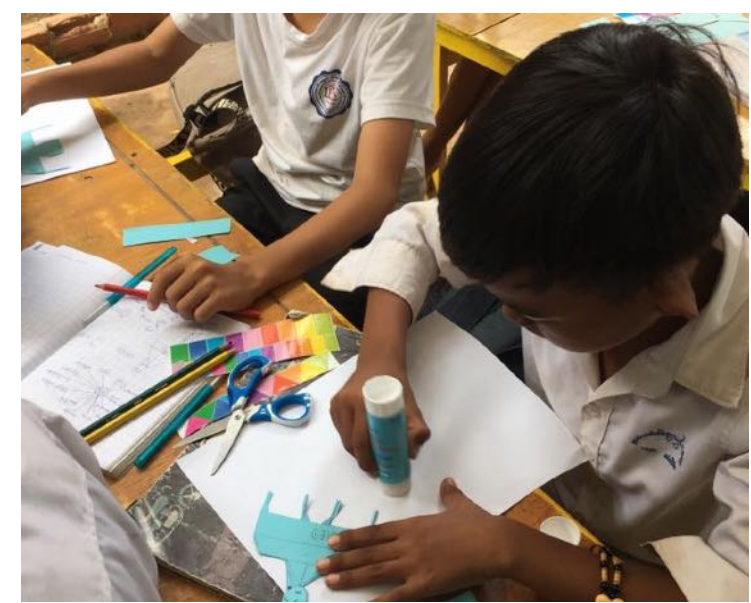
Apprendre différemment avec du matériel nouveau