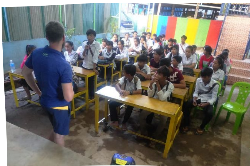
Ateliers linguistiques avec les ados