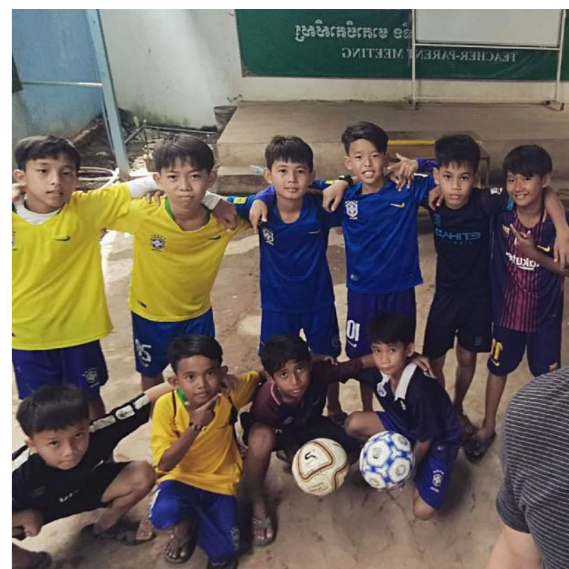
Atelier sport foot- volley