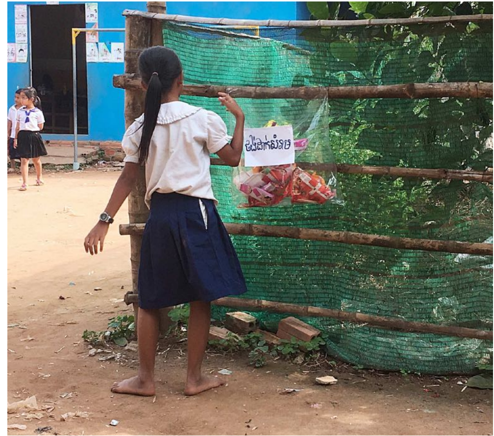
Apprendre à regrouper les déchets