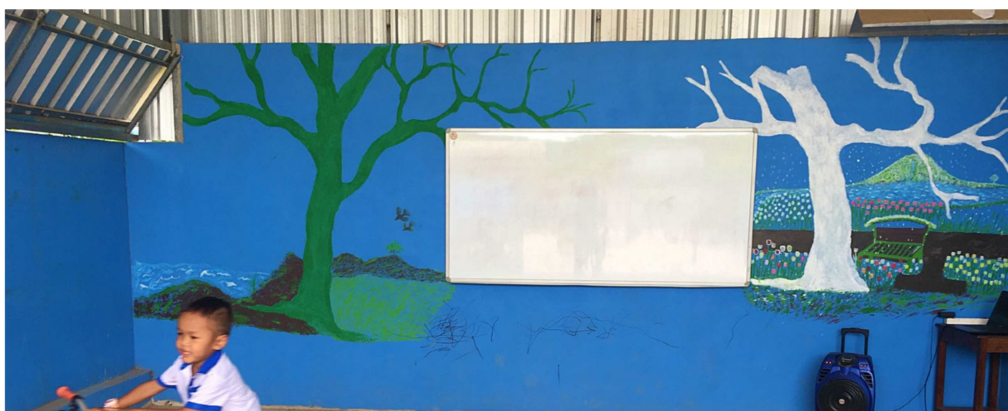
Passerelles interculturelles - fresque KATEKA