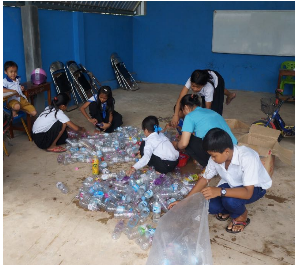
Atelier autour des déchets plastiques