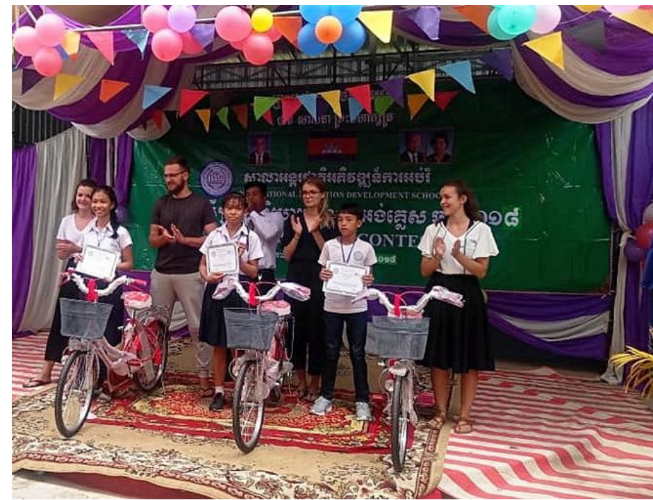
Jeux de cour et vélos offerts pour le trajet école-domicile