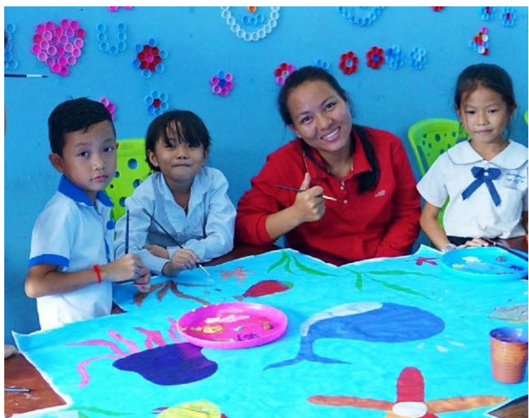
Atelier de groupe autour de la nature